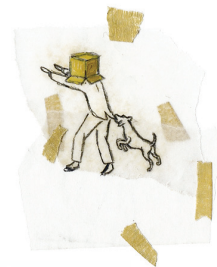
Francis Alÿs Image from "Le Temps du Sommeil" (dog biting man), 1998